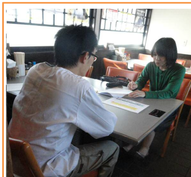
飲食店への助言を行っている社会保険労務士